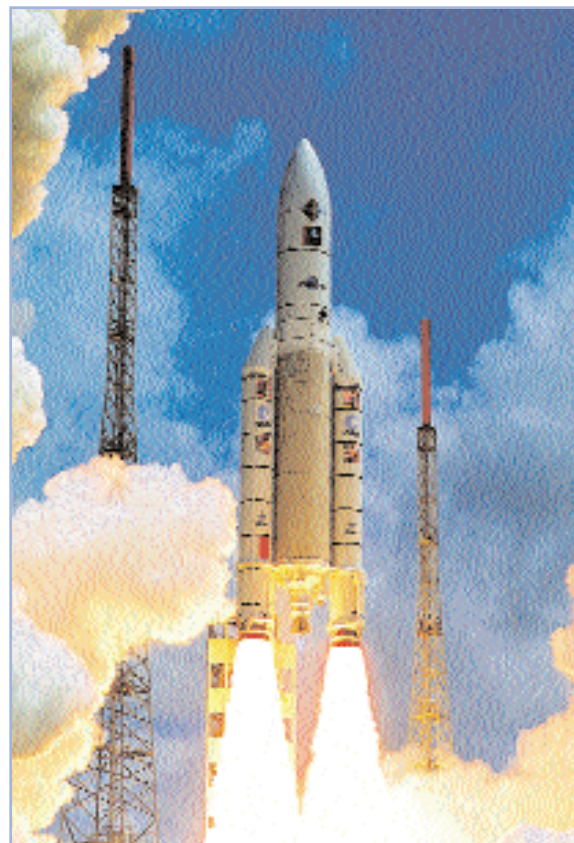
Decollo di un Ariane 5.

Per rendere i vettori ancora più efficaci, i materiali utilizzati sono estremamente leggeri in modo tale da ridurre il peso complessivo. Questi materiali non devono tuttavia essere soltanto leggeri, ma anche robusti e resistenti. Durante il decollo, i vettori devono resistere a vibrazioni molto intense, cosicché devono essere al tempo stesso flessibili e durevoli. Una volta nello spazio, i materiali presenti sulla parte esterna del vettore devono proteggerlo da raggi ad alta energia e piccole particelle e dalle temperature estreme, sia calde che fredde. Nello spazio le temperature possono infatti raggiungere i 200^{\circ}\text{C} in condizioni di esposizione al Sole o i -180^{\circ}\text{C} all'ombra.