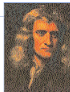
Sir Isaac Newton, 1642-1727.

Quando il combustibile brucia nel motore di un razzo, il calore generato lo trasforma in gas. I gas caldi vengono espulsi attraverso gli ugelli situati alla base del razzo, producendo l'azione. La reazione a questo fenomeno è il fatto che il razzo viene spinto verso l'alto nella direzione opposta.