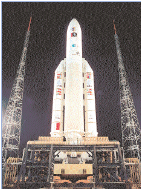
Il vettore europeo "Ariane 5".

Le diverse parti della ISS vengono inviate nello spazio con l'ausilio di razzi o vettori , come spesso vengono chiamati. Per trasportare gli astronauti sulla ISS vengono utilizzati due diversi vettori: il russo "Soyuz" e l'americano "Space Shuttle". Lo Space Shuttle, il Soyuz e, in futuro, altri veicoli di trasporto dell'equipaggio riporteranno gli astronauti sulla Terra.